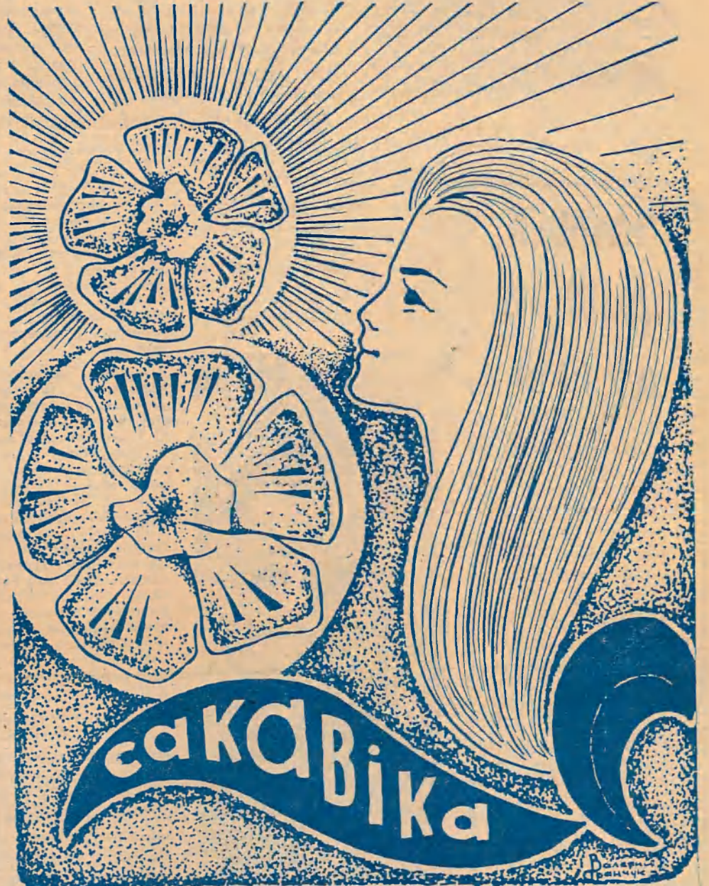
Малюнак студэнта журфака В. ДРАНЧУКА.

І. АЖЫГІН, прадэктар па адміністрацыйна-гаспадарчай частцы.